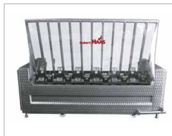
Macchina antistante postabile su 4 ruote orientabili